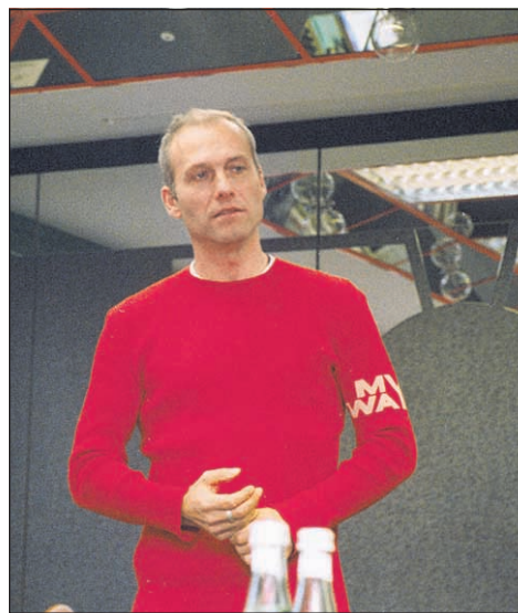
„Bilder überzeugen. Schon...“

Schlagfertigkeit ist für Pöhm, der eigentlich gelernter Software-Entwickler ist und